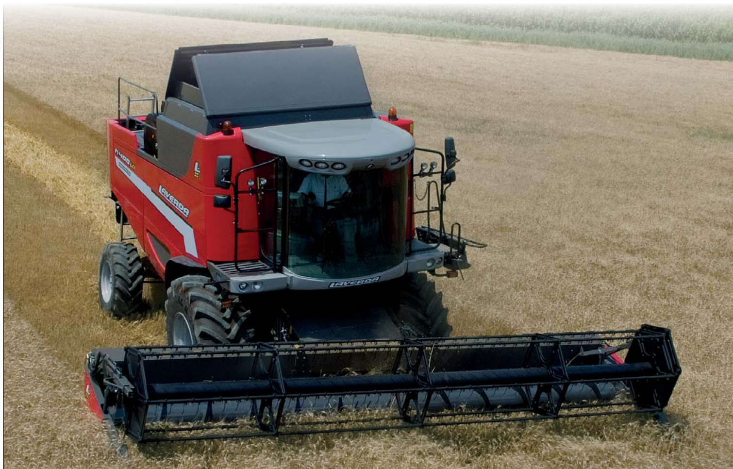
Sklízecí mlátička Laverda M410 Advanced LCI je největším modelem nové řady M400

Střední výrobní řada sklízecích mlátiček – dříve označovaná LCS, nyní nově M 300 series – byla rovněž přepracována. Dostala šasi a šikmý dopravník od doposud vyráběného největšího modelu. To umožnilo ne-