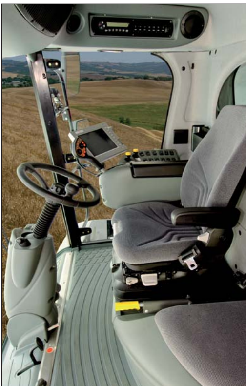
Kabina Commodor Cab II je vybavena dotykovým displejem GTA II a novou multifunkční ovládací pákou

Silný rám žacího stolu dostal větší úhel rozevření, což umožňuje lepší výhled z místa řidiče. Průběžný šnek má větší spirálu, díky které se zvýšila kapacita podávání o 15 % tak, aby tok materiálu odpovídal apetitu mláticího systému hnaného výkonným motorem. Přiháněč dostal pohon hydraulickým motorem – ten je umístěn na pravé straně žacího stolu kvůli lepšímu vyvážení. Nespornou výhodou použití tohoto systému