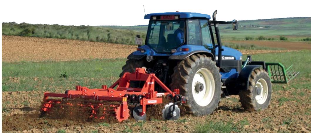
Diskový podmítač UFO 300 je vybaven dvěma řadami nezávisle uložených disků o průměru 610 mm