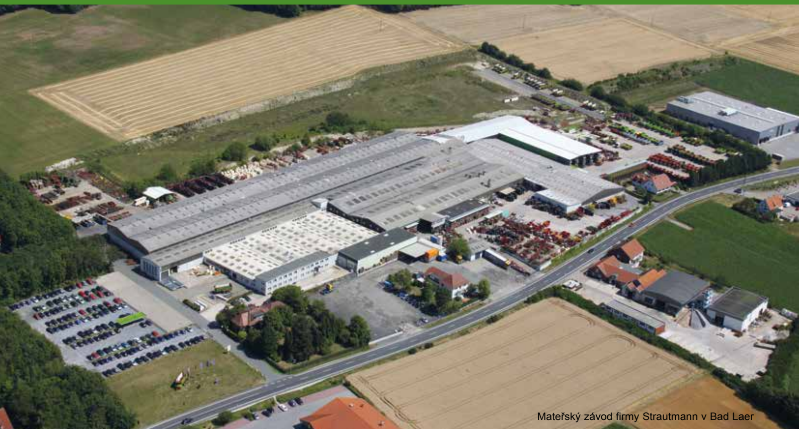
Mateřský závod firmy Strautmann v Bad Laer

Podnik B. Strautmann & Söhne GmbH u. Co. KG je středně velký Rodinný podnik v jižním Dolním Sasku. V současné době je v jeho čele již třetí generace majitelů, kteří jej před 80 roky založili. Ve druhém, moderně zařízeném výrobním závodu ve Lwówku (Polsko) vyrábí společnost Strautmann vedle jednotlivých strojních komponent i součásti svého výrobního programu, do něhož patří sklápěcí přívěsy, vybírací