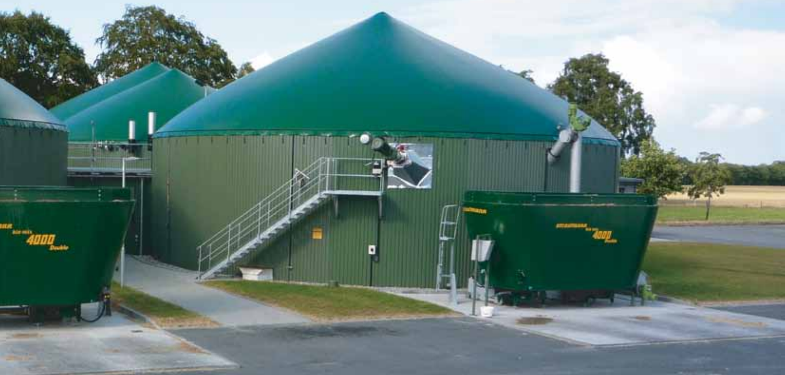
Optimales Befüllen von Beton- und Metallfermentern

Vertikalmischer stellen ein ideales System zur Feststoffdosierung dar, da sie zum Einen ein enormes Volumen verarbeiten können, zum Anderen aber dieses Volumen homogenisieren und so dem Ökosystem Biogasanlage ein ständig konstant zusammengesetztes Ausgangsmittel liefern. Darüber hinaus sind die Vertikalmischer aus dem Hause Strautmann durch ihre speziell konzipierte Schneckenform extrem sparsam im Energieverbrauch. Sie sind also von enormer Wichtigkeit für die umweltfreundliche Erzeugung von Strom und Wärme aus Bioenergie.