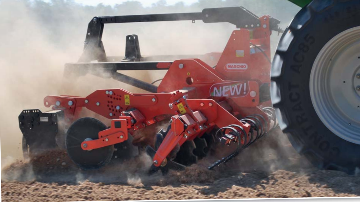
Nesený diskový podmítač PRESTO lze vybavit tříbodovým závěsem pro připojení secího stroje

Samostatně uložené disky o průměru 610 mm jsou k rámu připevněny pomocí pružných slupic o průřezu 40 x 40 mm vyrobených ze speciální oceli. Zajímavostí tohoto uložení je tzv. 3D efekt, který umožňuje výkyv talíře všemi směry – talíř v půdě vibruje, čímž je půda lépe zpracována. Velkým plusem těchto talířových podmítačů je použití bezúdržbových ložisek s dlouhou životností. O tom svědčí i fakt, že např. u 6m provedení je na ložiska poskytována záruka 10 000 ha!