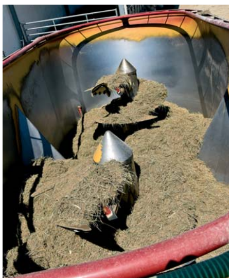
Voz s objemom 19 m 3 možno zvýšiť nadstavbami (aj dodatočne) na 21,5, resp. 24 m 3 . Výhodné pri raste farmy a počtu zvierat. Dve závitovky si poradia aj s celým balíkom, čo ušetrí jeden rozdružovač.