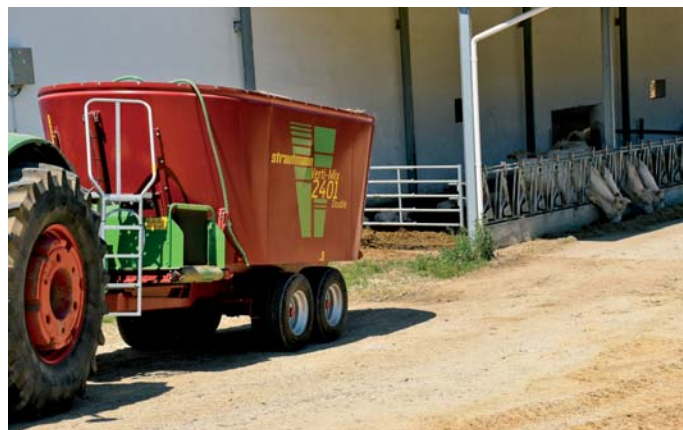
Strautmann Verti-Mix na farme s dobytkom bez trhovej produkcie mlieka.