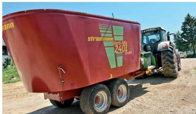
Kvôli svahovitým podmienkam vybrali dvojítu nápravu. V poradí už tretí voz Strautmann na farme ťahá luxusný z rastlinnej výroby vyradený Fendt 936.

V Agro-Taks začínali s ťahanými krmnými vozmi s horizontálnou miešacou závitovkou. Ďalší ťahaný voz inej značky vyme-