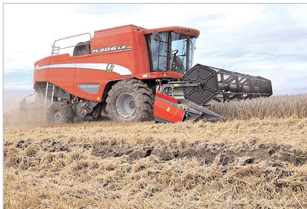
Loňské žne byly pro Laverdu M306 SP LS 4WD díky pohonu všech kol hračkou

"Můj starý kombajn už dosloužil a mnoho známých mně varovalo před koupí ojetého stroje ze zahraničí. Proto jsem si koupil kombajn nový - nemám obavu z nečekaných výdajů, jako bych měl u ojetého a díky prodloužené záruce jsem na dlouho bez starostí - a to vše za cenu ojetého kombajnu. S Laverdou navíc díky její spotřebě ušetřím."