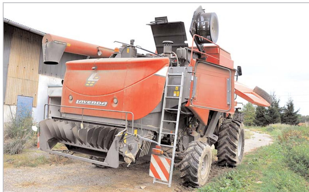
Snadný přístup ke všem místům údržby je pro Laverdu typický stejně jako její jednoduchost

cesta pouze na laně vyprošťovacího traktoru. Tím si Laverda vysloužila respekt nejen u zemědělců, ale i u posádek sklízňové techniky „věhlasných značek“.