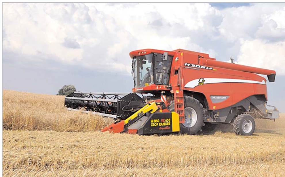
Skřížecí mlátička Laverda M306 SP LS 4WD osazená vario adaptérem BISO CropRanger VX650

Aspektů, které ovlivňují čistotu zrna, je víc, například konstrukce sít, jejich kinematika, typ ventilátoru, ale přesto plocha hraje roli největší. V uplynulých letech