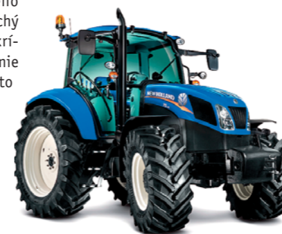
Novinka strednej triedy New Holland T5

predchodcov veľmi nelíšia. Traktor bol doplnený o systém SCR so vstrekovaním roztoku AdBlue s 37 litrovou nádržou. Výsledkom je sedem modelov T6.120, T6.140, T6.150, T6.160, T6.155, T6.165 a T6.175. Prvé štyri sú štvorvalce a ostatné tri sú šesťvalce CommonRail.