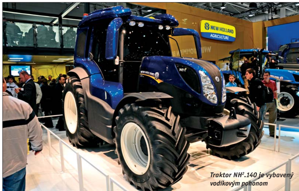
Traktor NH 2 .140 je vybavený vodíkovým pohonom