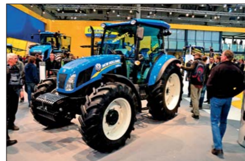
Traktor New Holland TD5 na tohtoročnej Agritechnice absolvoval premiéru