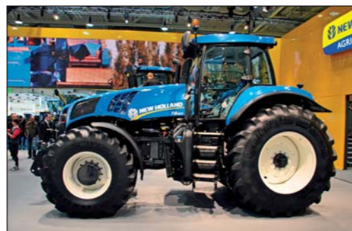
Model T8.420 AutoCommand. Model T8.420 AutoCommand bude dostupný koncom roka 2012

Inteligentný brzdiaci systém návesu spolu s ABS SuperSteer boli ďalšími ocenenými komponentmi. Zmysel spočíva v ABS ako pri osobných autách. Pri prudkom brzdení nedochádza k zablokovaniu kolies a nekontrolovanému posunu súpravy po vozovke. Základom je pozvoľné brzdzenie tak, aby sa kolies traktora, ako aj návesu pretáčali a umožnili kontrolované zastavenie s prípadnou možnosťou zmeny smeru. Brzdový systém ABS SuperSteer™ navyše využíva technológiu individuálneho brzdzenia kolies, vďaka čomu sa výrazne znížil polomer otáčania traktora na úvratí. Pri otáčaní stroja je v závislosti na uhle natočenia kolies prednej nápravy príbrzdované vnútorné zadné koleso