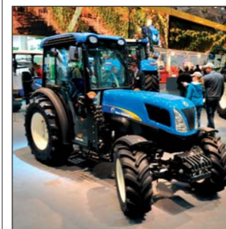
Novinkou v oblasti špeciálnych traktorov je model T4060 F s výkonom motora 106 koní

Rad T5000 má nasledovníka v modeloch T5. Traktor prešiel kompletnou inováciou. Je celkovo väčší a má tri modely T5.95, T5.105, T5.115. Dostal nový štvorvalec s objemom 3,4 litra CommonRail. V základnej konfigurácii je elektronické ovládanie zadného trojbodového závesu, prevodovka 24x24 Hi-Lo známa z T5000, nastaviteľný volant, kabína s klimatizáciou, sedadlo spolujazdca s bezpečnostným pásmom, ... Postupne sa pri traktoroch T5 doč-