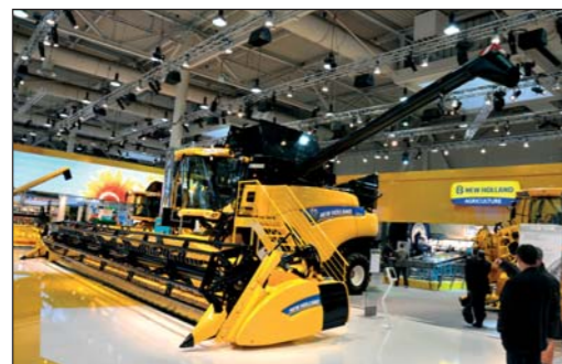
Stroj roka 2012 kombajn New Holland CR9090 so žacou lištou BISO Ultralight 800

Zameriam sa na giganta v oblasti vývoja poľnohospodárskej techniky, spoločnosť New Holland. Firma znovu potvrdila na výstave Agritechnica 2011 svoju pozíciu nielen veľkou svojou expozíciou a množstvom vystavených strojov, ale i počtom získaných prestížnych ocenení. Celkovo je to päť strieborných medailí od nezávislej poroty z DLG inštitútu. Novinárska komisia udelila značke New Holland ešte ďalšie ocenenie „Stroj roka 2012“ pre kombajn New Holland CR9090 na pásovom podvozku SmartTrax s lištou BISO Ultralight 800 so záberom 12,2 metra vo farbách New Holland.